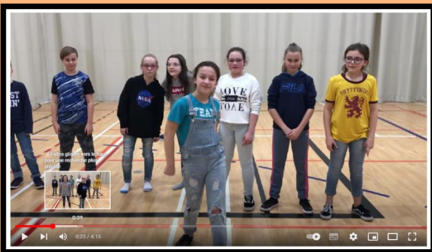
Pause active Ecole Daigneau