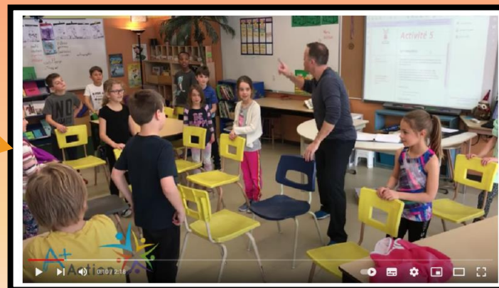
Bouge ta chaise

Cliquez sur l'image pour accéder à plus de contenu !