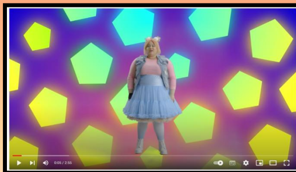
Pause active wixx