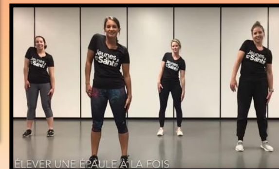
Jeunes en santé

Cliquez sur les images pour accéder à plus de contenu !