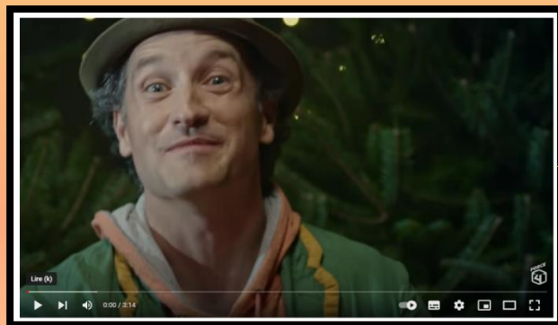
Autour du feu