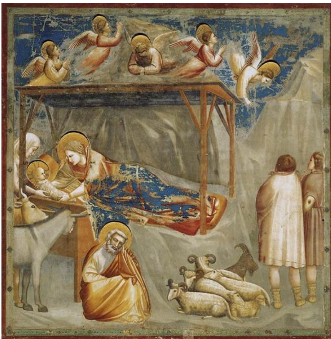
« La Nativité du Christ » (1303/1306), Giotto (1267—1337), Chapelle des Scrovegni (Padoue, Italie)