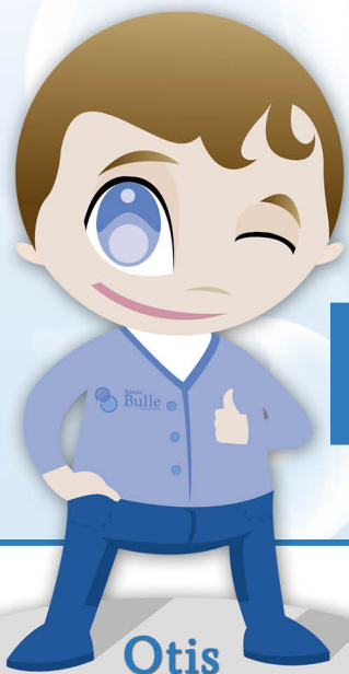
Mascote de Réseau Bulle France

À destination des Établissements Scolaires